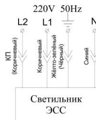
Светильник с аварийным режимом L1 - основное питание L2 - контроль присутствия U (подключать от эл. сети 220В фаза)